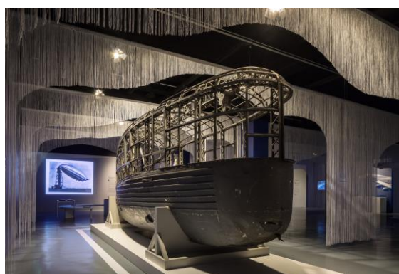
Ausstellungsansicht Vernetzung der Welt Gondel L30 2019