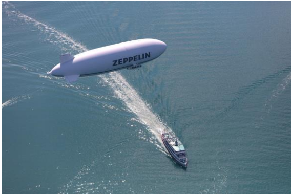
Zeppelin NT