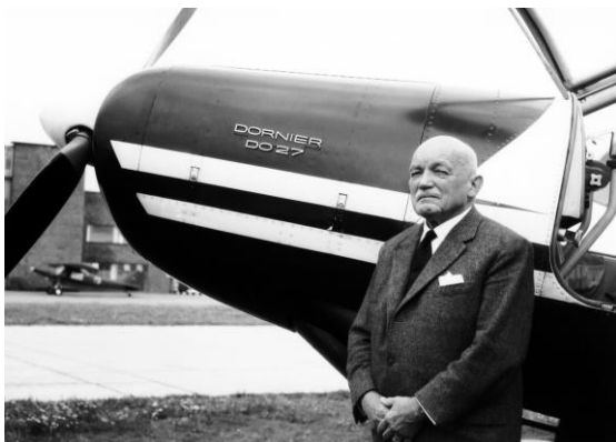
Claude Dornier