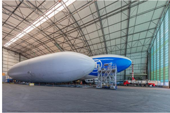
Zeppelin Werft