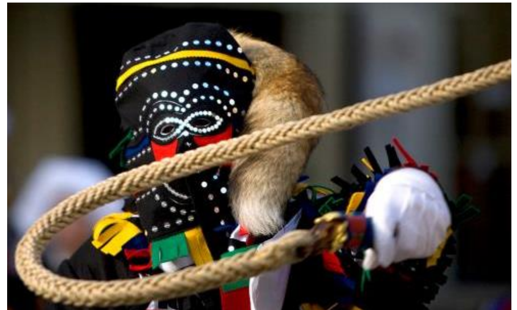
Carnaval aan de Bodensee