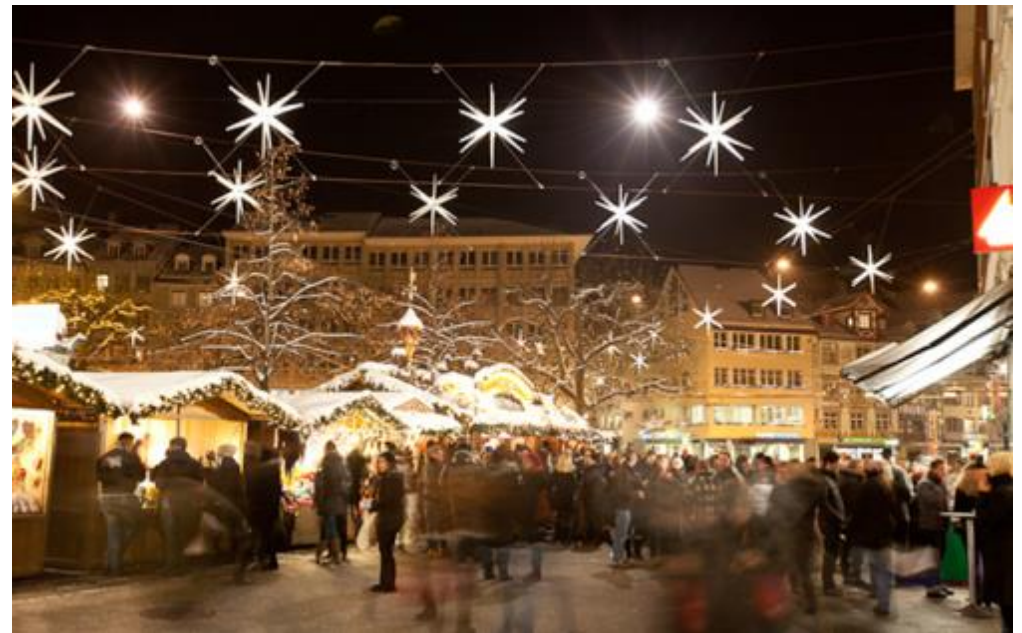
St.Gallen – de sterrenstad