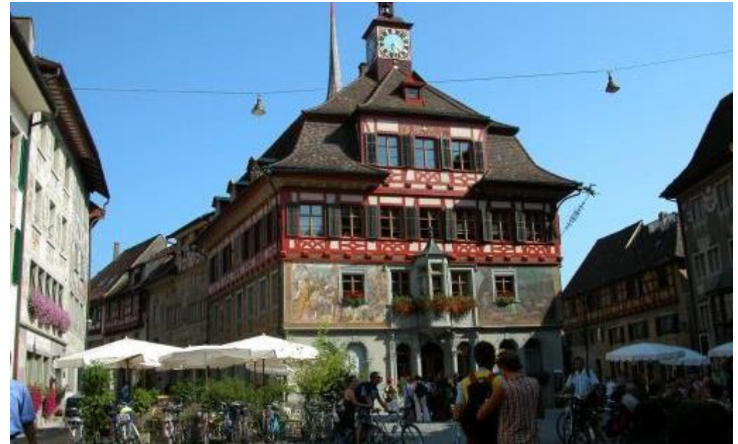
Stein am Rhein