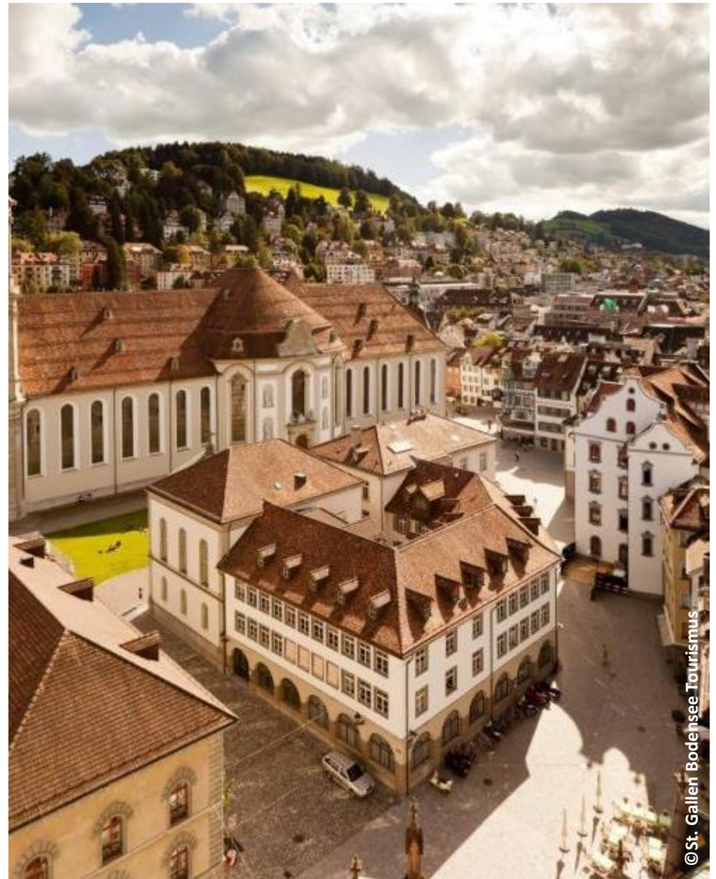
De abdij van St.Gallen